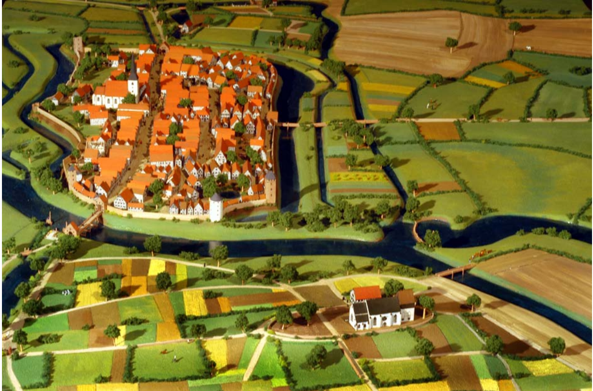
Blick von Norden über die einsam gelegene St. Marien-Kirche auf die niedriger gelegene Neustadt (Stadtmodell „Lünen um 1700“;)