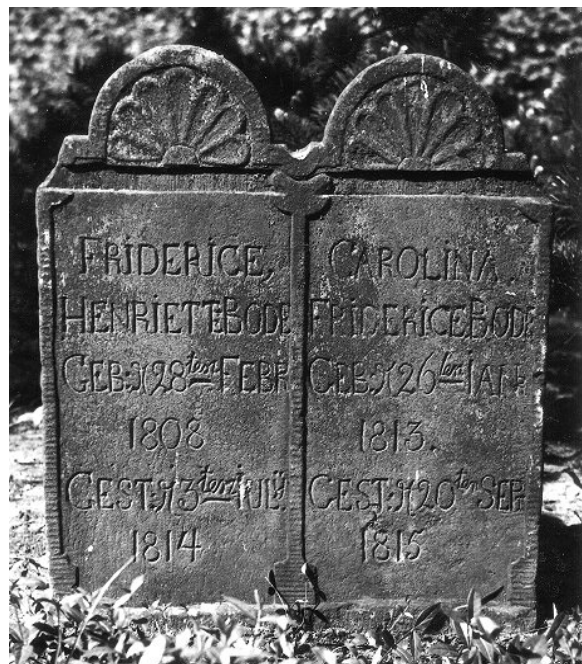
Doppelgrabstein der 1814 und 1815 verstorbenen Geschwister Bode

Wissenschaftler hatten herausgefunden, dass beim Verwesen des Leichnams toxische Stoffe freigesetzt werden, die zum Teil sehr giftig sind. Der Mensch besteht zu 80 Prozent aus Wasser, 20 Prozent sind Eiweiße und Fette. Während die Fette abgebaut werden, zersetzt sich das Eiweiß zu „Leichengiften“. Daneben besteht die Gefahr, dass während des Verwesungsprozesses Bakterien und andere gesundheitsgefährdende Erreger freigesetzt werden. Bei Bestattungen innerhalb von Wohngebieten konnten das „Leichengift“ und die Bakterien bzw. Erreger in das Grundwasser der für die Wasserversorgung notwendigen Brunnen und somit in den Körper des Menschen gelangen.