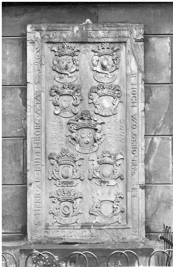
Grabplatte der Familie von Frydag zu Buddenburg an der St.-Georgskirche, um 1905 (heute im Tobiaspark)

umfangreichen Renovierung 1902 bis 1908 entfernte man rund 20 Grabplatten um den Taufstein im Chor und im Turm aus der Kirche und stellte sie an den Außenmauern des Gebäudes senkrecht auf, wo sie nun den Witterungseinflüssen ausgesetzt waren; an ihrer Stelle wurden einfache Steinplatten als Fußbodenbelag verlegt. 1938 wurden acht, noch ziemlich gut erhaltene Platten von den Außenwänden abgenommen und im Turm sichergestellt. Im Zuge der Neugestaltung des Tobiasparks 1948 verlegte man sie zum Tobiasfriedhof, die den Witterungseinflüssen nun vollends ausgesetzt waren. Vier von ihnen wurden im Juni 1972 wegen der Verwitterungsgefahr wieder an der Außenmauer der St.-Georgskirche angebracht. Die anderen Grabplatten waren bereits derart angegriffen, dass man sie auf dem Tobiasfriedhof liegen ließ; die Inschriften sind inzwischen völlig verwittert.