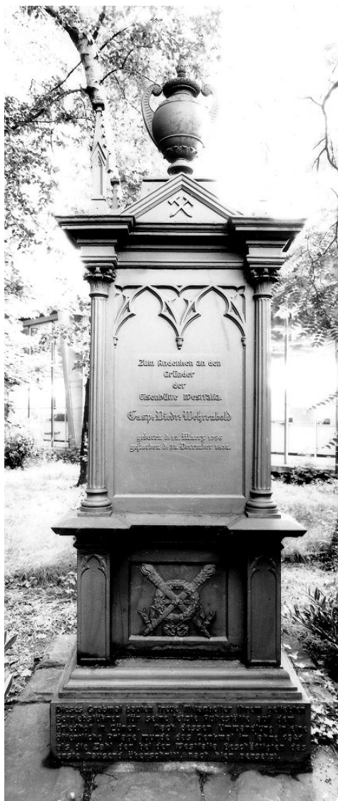
Gusseisernes Grabdenkmal für Caspar Diederich Wehrenbold, Mitbegründer der Eisenhütte Westfalia, auf dem ehemaligen Werksgelände der Eisenhütte Westfalia

Der Tobiasfriedhof erwies sich aufgrund der Bevölkerungszunahme schon 1839 als zu klein. Im selben Jahr kaufte deshalb die evangelische Kirchengemeinde den im Osten angrenzenden Garten. 1841 wurde ein weiteres, ursprünglich für den Bau eines Wohnhauses vorgesehenes Grundstück zur Verschönerung des Eingangsbereiches zum Totenhof angekauft, auf dem wegen der unmittelbaren Lage an der Münsterstraße jedoch nicht beerdigt werden sollte. Das Eingangstor sollte in die Mitte der Westseite verlegt und der von hier zum Friedhof führende Hauptweg zu beiden Seiten mit Strauchwerk bepflanzt werden, um so einen freundlichen Eingang zum Gottesacker zu schaffen und zugleich zur Verschönerung der Straße in diesem Bereich beizutragen.