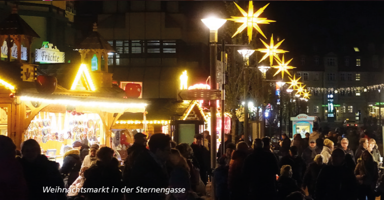
Weihnachtsmarkt in der Sternengasse