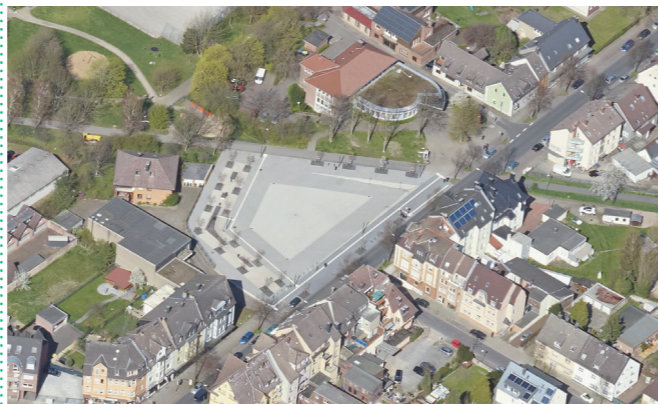
Erstellt mit dem 3D-Schrägluftbildviewer des Kreises Unna - Vermessung und Kataster, CC BY-NC-SA 4.0

Unweit des Bürgerplatzes gibt es ferner den großen Parkplatz am Friedhof in Lünen-Süd. Auf diesen sollte bei der Bewerbung der Veranstaltung hingewiesen werden, da das Parkplatzangebot an der Jägerstraße begrenzt ist.